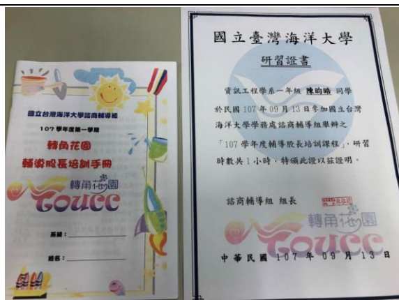
培訓手冊及研習證書