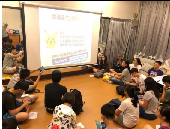
輔導股長執掌及協助宣導事項說明-2