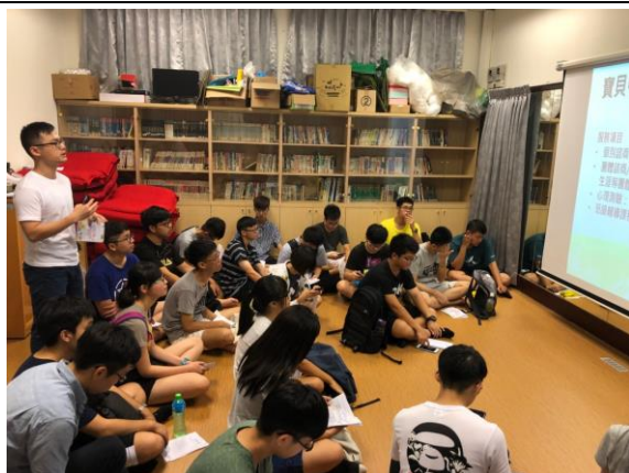
輔導股長執掌及協助宣導事項說明-1